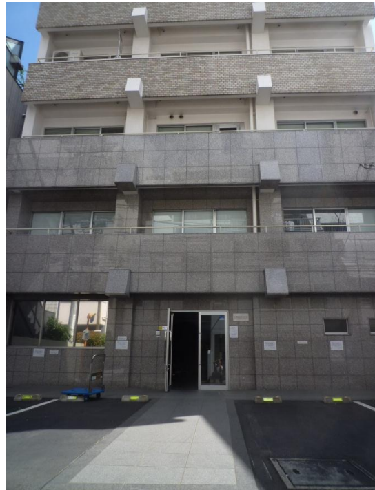
北面正面エントランス