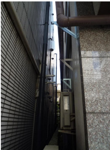
東面の隣との空間