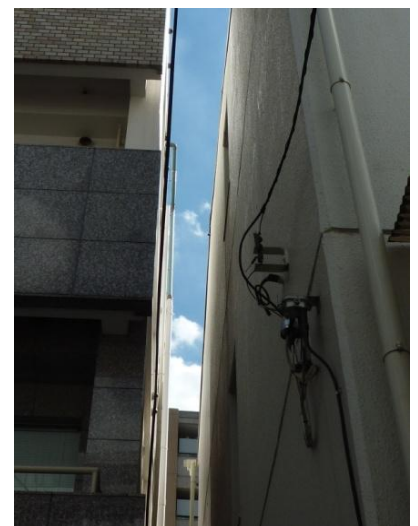
西面の隣との空間